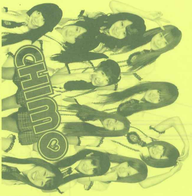
女子校生 アイドルユニット CHIMO 午後6:40～7:20